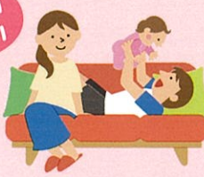
おねがい会員 (依頼会員)