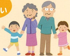
まかせて会員 (協力会員)