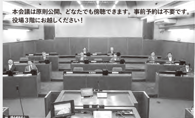
本会議は原則公開、どなたでも傍聴できます。事前予約は不要です。役場3階にお越しください！