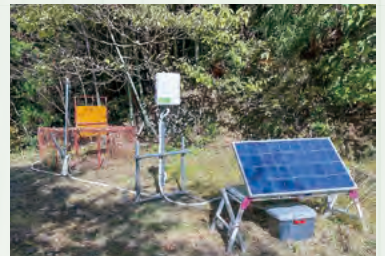
ICTを活用した箱わな