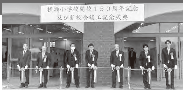
小泉衆議院議員、阿左美県議会議員とテープカット

工事は、第1校舎の改修、特別教室棟の解体が残っています。予算執行の調査を含め引き続き見守っていきます。