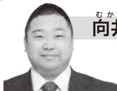
向井芳文議員が聞く！