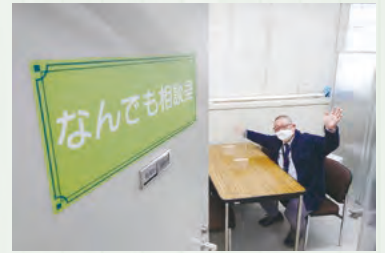
お待ちしております～す

今回のテーマは「なんでも相談室の現状と課題」と「教育委員会報告」について。「なんでも相談室の現状と課題」については、窓口のあり方に関する事、役割分担に関する事、体制に関する事、各課との連携に関する事等の質疑がされました。