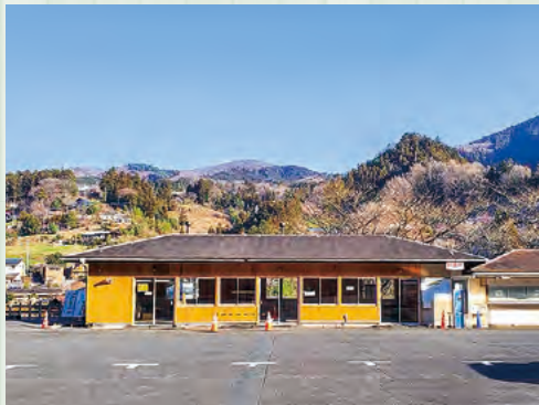
A-STA.BA (あしがくぼステーションベース)

「あしがくぼの氷柱」の開催に合わせ、土日祝日に待合所として開放していました。今年4月からは、駅利用者用の待合所と登山者の着替えスペースとして活用されています。