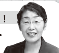
大野伸恵議員が聞く！