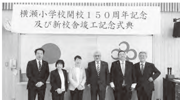
広報常任委員会のメンバーで記念撮影