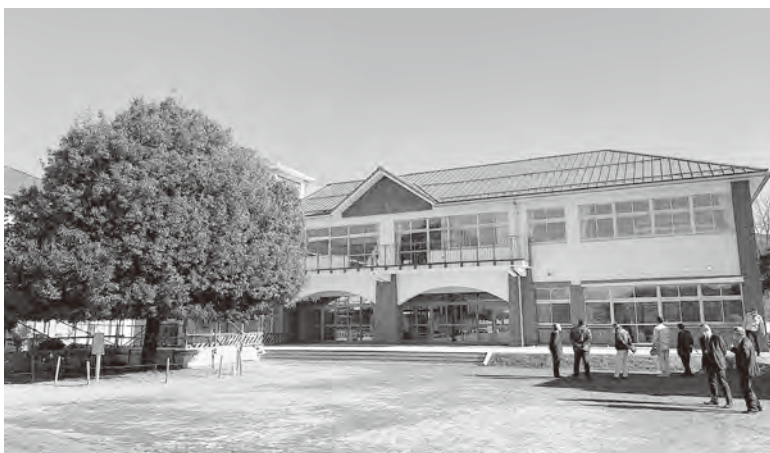
第1期工事完了後の新校舎外観