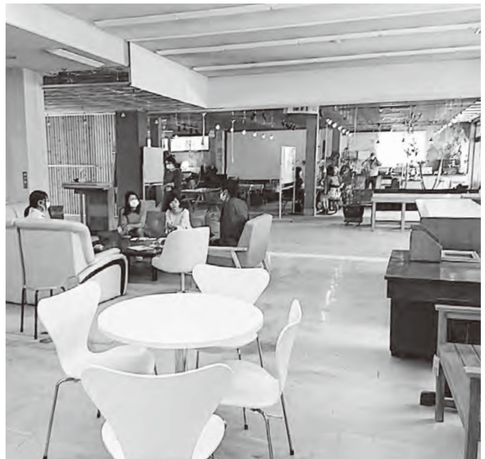
5月下旬オープン予定 旧JAちちぶ横瀬支店がテレワーク拠点に生まれ変わります！

答 エリア898のトイレ整備など実施。地元事業者と連携して地域活性化事業を進めたい。説明はしていきたい。