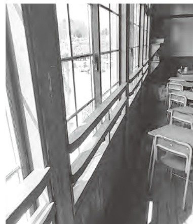
左：LED照明 右：複層ガラス