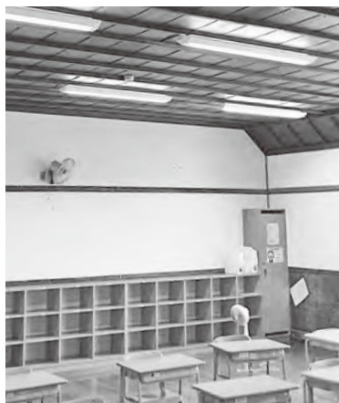
第1校舎の改修工事後の教室内