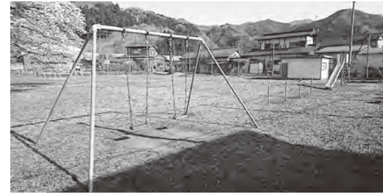
みんながもっと使ってくれるといいな