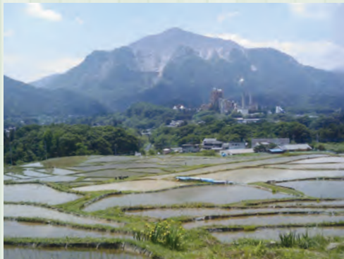
大きくそびえる武甲山 チチブイワザクラは町の花です

この花はチチブイワザクラという花で、武甲山の岩場に生えている珍しい植物です。花は赤紫色で直径2～3センチほどです。茎や葉裏に赤い細かい毛があるのが特徴です。※自生地は私有地のため、立ち入ることはできません。