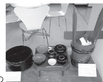
明治~昭和時代の共有道具