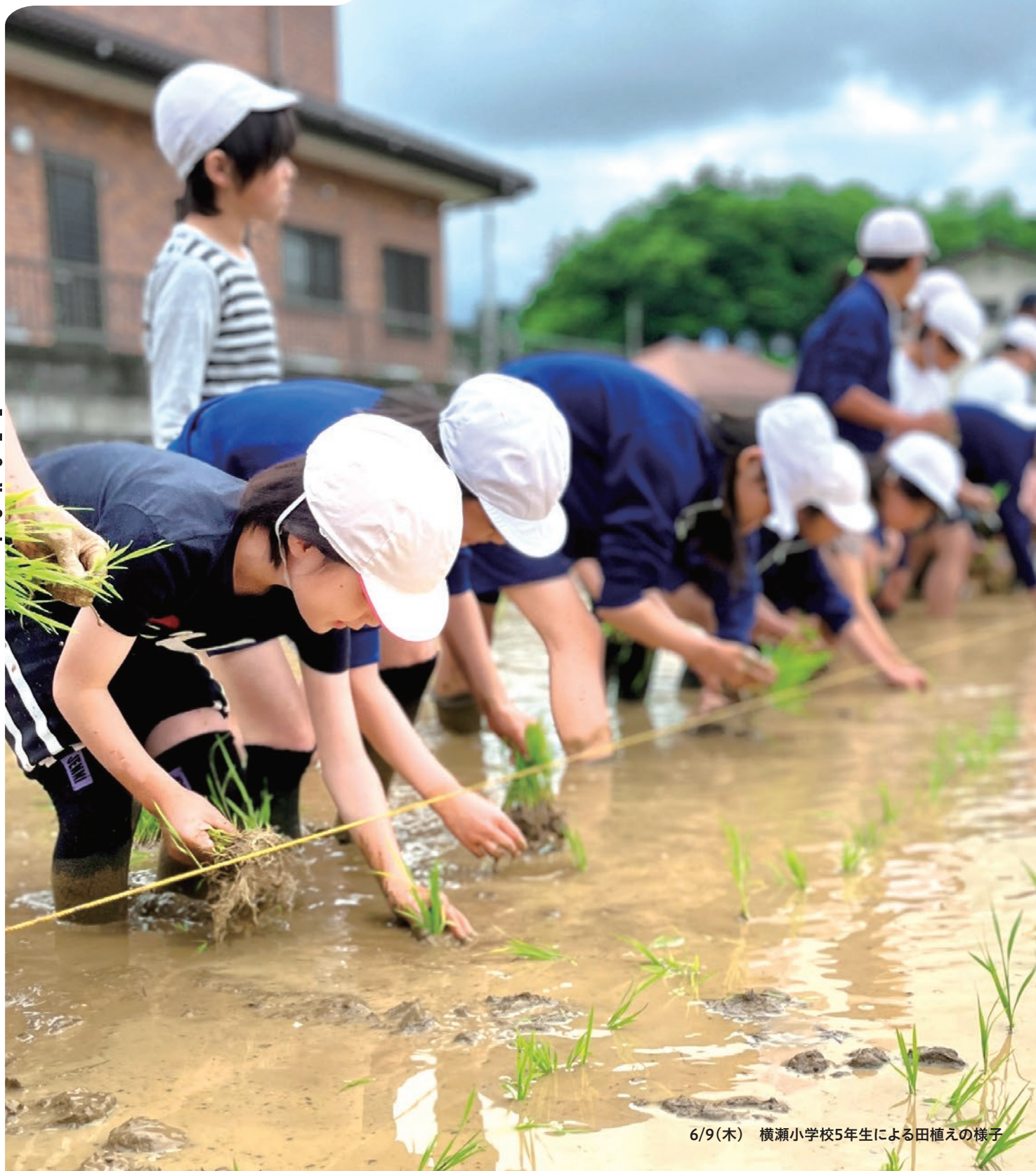
6/9(木) 横瀬小学校5年生による田植えの様子