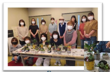
クリスマスハーバリウム