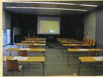
▲間隔を開けての受講