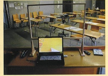
▲講師席にアクリル板を設置