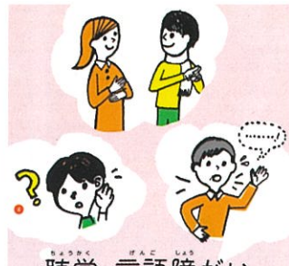
聴覚・言語障がい