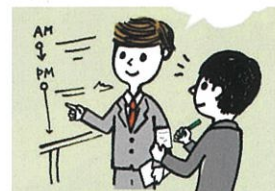
高次脳機能障がい