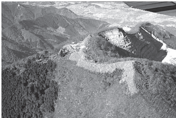
武甲山山頂遺跡(1977年撮影)