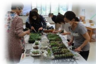
趣味の公民館講座 『インドアグリーン』 が開催されました。