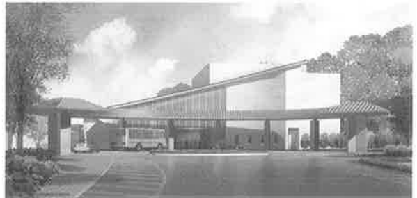
新火葬場完成イメージ

なお、新火葬場の名称は引き続き「秩父斎場」です。来年3月31日までの仮オープン期間中は、駐車場や1日の火葬件数など一部に使用制限がありますので、期間中の使用料は、現斎場と同額です。