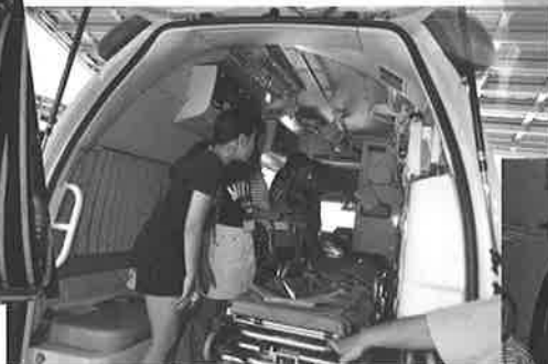
●秩父消防署東分署●