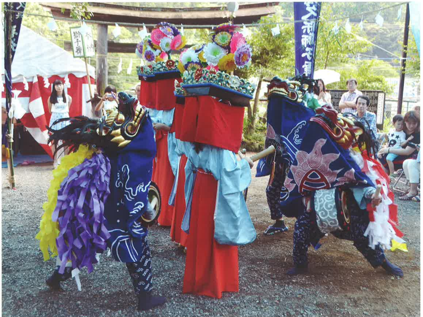
白鬚神社にて芦ヶ久保の獅子舞が奉納されました [8月16日]