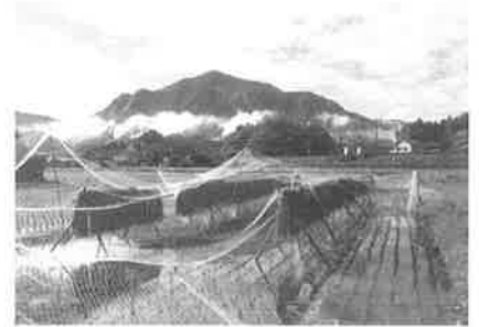
「姿っ原の田んぼと武甲山」平成22年撮影

「寺坂棚田」や「姿っ原」など田んぼから望む秩父のシンボル「武甲山」の容姿をぜひご覧ください。