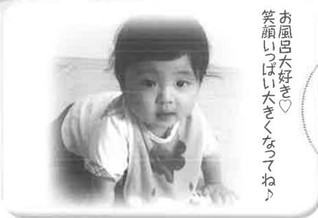
お風呂大好き♡ 笑顔いっぱい大きくなってね♪