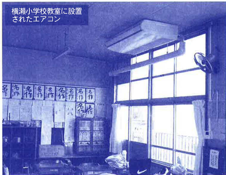
横瀬小学校教室に設置されたエアコン