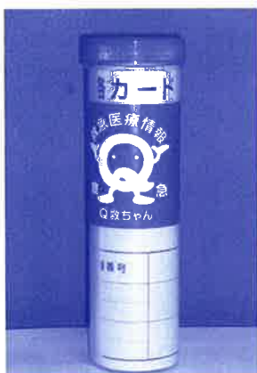
配布されている医療情報キット

答 保育所長兼児童館長：就学時前の子どもを預かっているので、通っている子どもたちの安全・安心のためにも検討していきます。