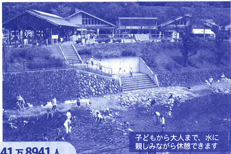
子どもから大人まで、水に親しみながら休憩できます