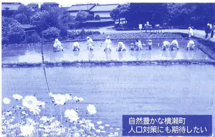
自然豊かな横瀬町 人口対策にも期待したい

確かに実効性はあると思いますが、どう人員を割くかが難しいところ。何らかの手立てを打たなければいけない時期に来ていると認識しています。