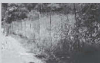
宇根地区の侵入防止柵（電柵）

町としては今後も引き続き「横瀬町鳥獣被害防止計画」に基づいて実施していくとのことでした。