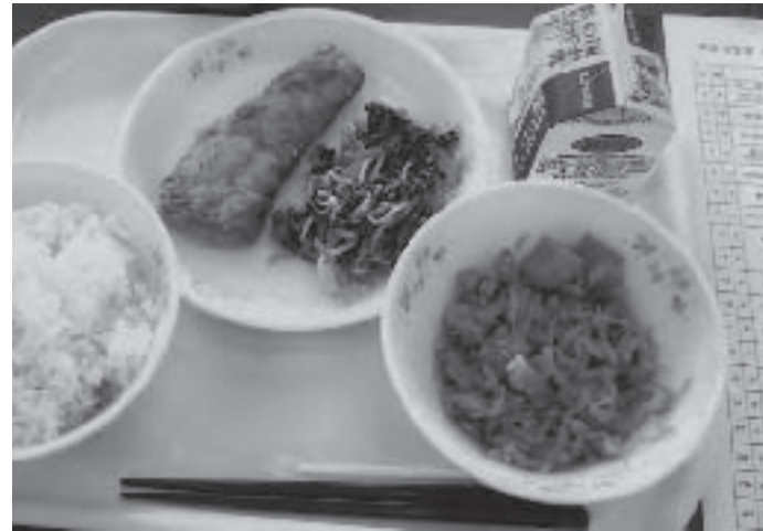
議会2日目、横瀬町の学校給食を試食しました。