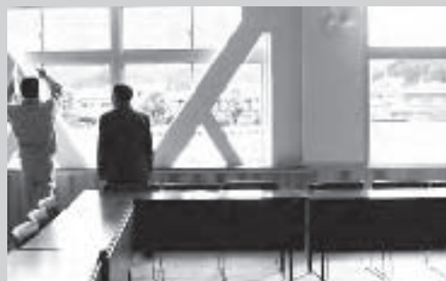
9月28日に議員全員で視察しました