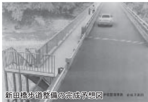
新田橋歩道整備の完成予想図

問 今回は新田橋への歩道設置のみですが、将来、橋前後の歩道化についての考えを伺う。特に橋から町道2号線交差点までについて伺う。