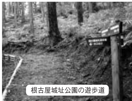
根古屋城址公園の遊歩道