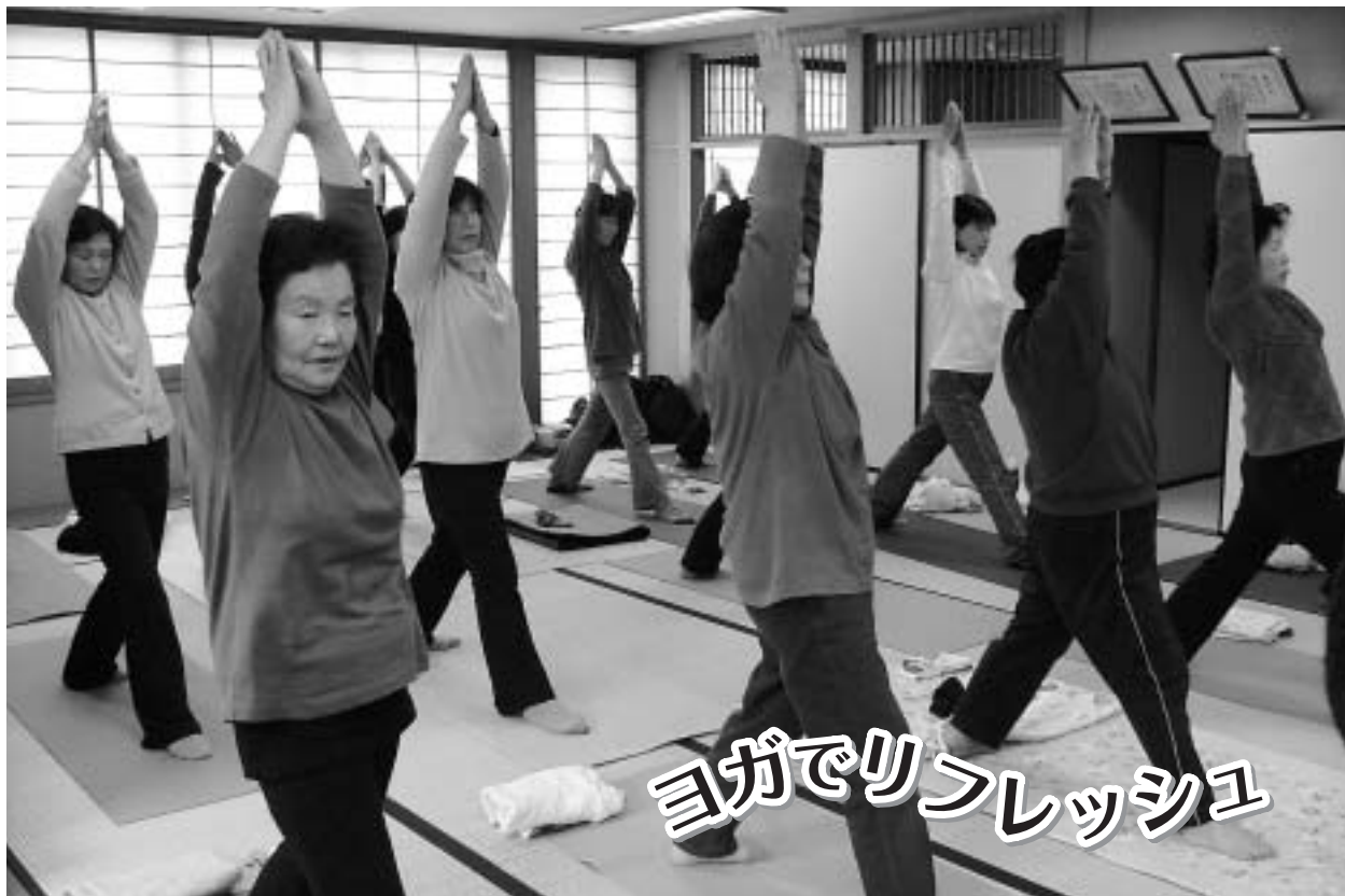
ヨガでリフレッシュ