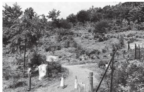
ボランティアの皆様、いつもありがとうございます！ 本当にお疲れさまです。

(*)クアオルト…ドイツ語で療養地の意味。心拍数や血圧を測定しながら、個々に合わせて無理のない運動をして健康づくりをしていくもので、横瀬町は太陽生命が行っている「クアオルト健康ウォーキングアワード2018」において、全国で3自治体の優秀賞に選ばれました。