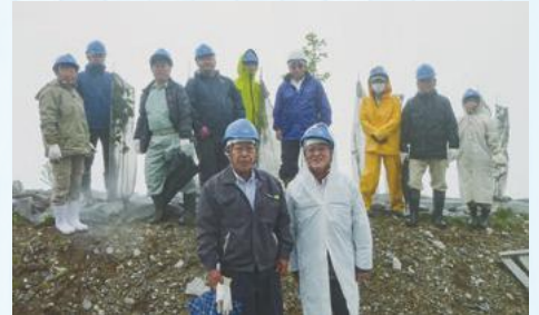
昨年植樹した木の前で「ハイ、チーズ！」

小雨降り注ぐ中、感謝を込めて植樹させていただきました。後世のために残さなければいけない産業と自然。同じ舞台で起こるドラマに、複雑な思いと現実。今できること、やるべきことをやっていくしかない、考えさせられる1日でした。