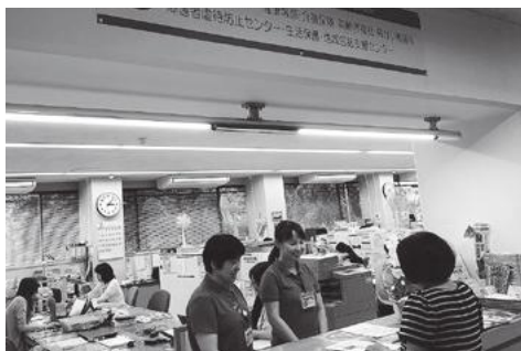
相談は健康づくり課へ「頼りにしてます!」

5月29日に行われ、所管事務調査として、健康づくり課長より障がい福祉サービスについての概要を障害者総合支援法による「障がい福祉サービス利用の手引き」の資料に基づき、説明を受けました。