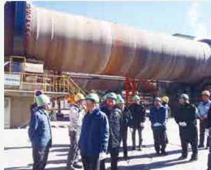
ロータリーキルンの前で説明を受ける

り、セラミック工場とセメント工場を視察。製造工程や産業廃棄物受入・処理状況等の説明を聞きました。横瀬工場で生産されたチップアンテナが電子部品で活躍しているなど、新たな発見もありました。