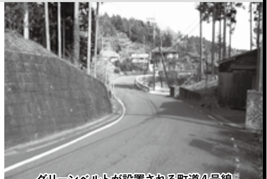
グリーンベルトが設置される町道4号線

よこらば...個人や団体、企業から事業を広く募集し、法的課題やコミュニティの問題解決のために横瀬町が連携するという取り組み。