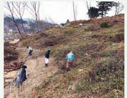
植樹ができるように整備をしました

2月2日(木)、(仮称)花咲山の整備に対して、切り倒された大木や、野積みされている枝などを片付け、植樹できるようにしようと、議会・農業委員会・観光産業振興協会・振興課などが共同して作業を行いました。