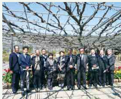
樹齢150年の大藤の前で

3月17日(金)、(仮称)花咲山公園整備事業に伴う樹木の管理等を目的として、あしががフラワーパークとみかも山公園を視察。藤の剪定状況、今を彩るチューリップやパンジーなどの手入れ等を見るとともに所長から説明を受けてきました。