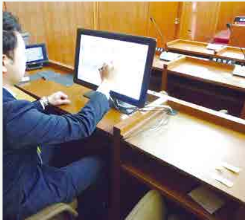
議場では、会議録作成用に発言を録音しています

このパソコンを使って、議会事務局の職員が、カメラとマイクの操作をしています。その映像と音声は庁舎1階フロアのテレビや、3階の会議室で見ることができます。傍聴にお越しの際は、こんなところにも注目してみてくださいね。