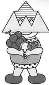
横瀬町イメージキャラクター 「フコーさん」