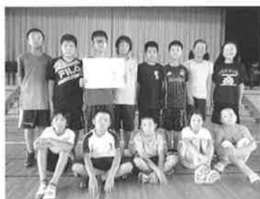
山びこチーム(準優勝)