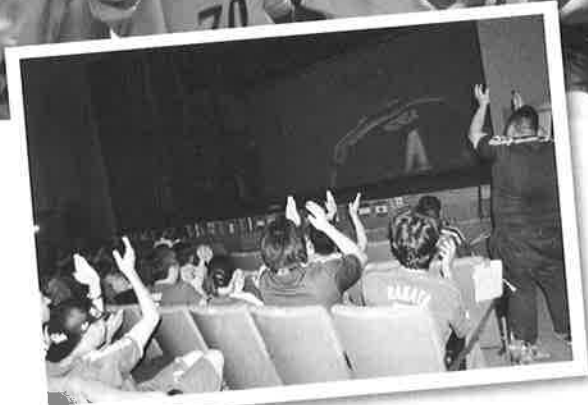
元Jリーガーを囲み、 サッカーワールドカップ日本代表をみんなで応援しました。 [6/15パブリックビューイング]