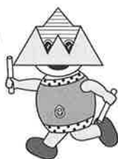
横瀬町イメージキャラクター「プコーさん」