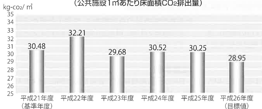
図 振興課 産業・環境グループ ☎25-0114