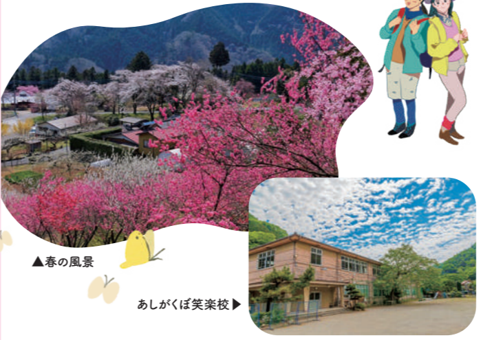
▲春の風景 あしがくぼ笑楽校

提案者のおすすめポイント 森の中で深呼吸をすれば、里山のマイナスイオンを感じ、鳥のさえずりに癒されます。また、絶景や文化財を巡ったり、あしがくぼフルーツガーデンではうんとあずき茶をいただき、五感全てを満たせる充実ぶり。懐かしいあの頃を思い出させてくれるフォトスポットもあるネイチャーコース!