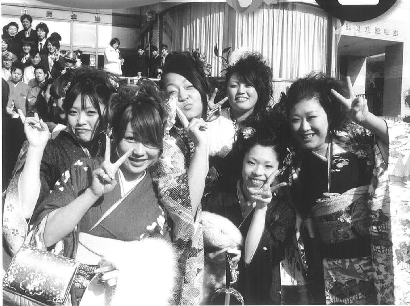
晴れやかな表情で節目の年を迎えました 1/10(横瀬町成人式)