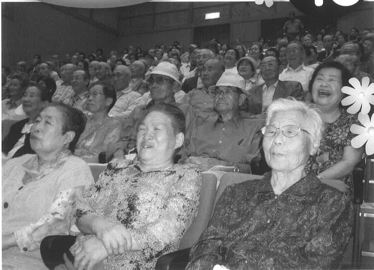
笑いは幸せを呼び、健康の源となります。敬老会(9/17)