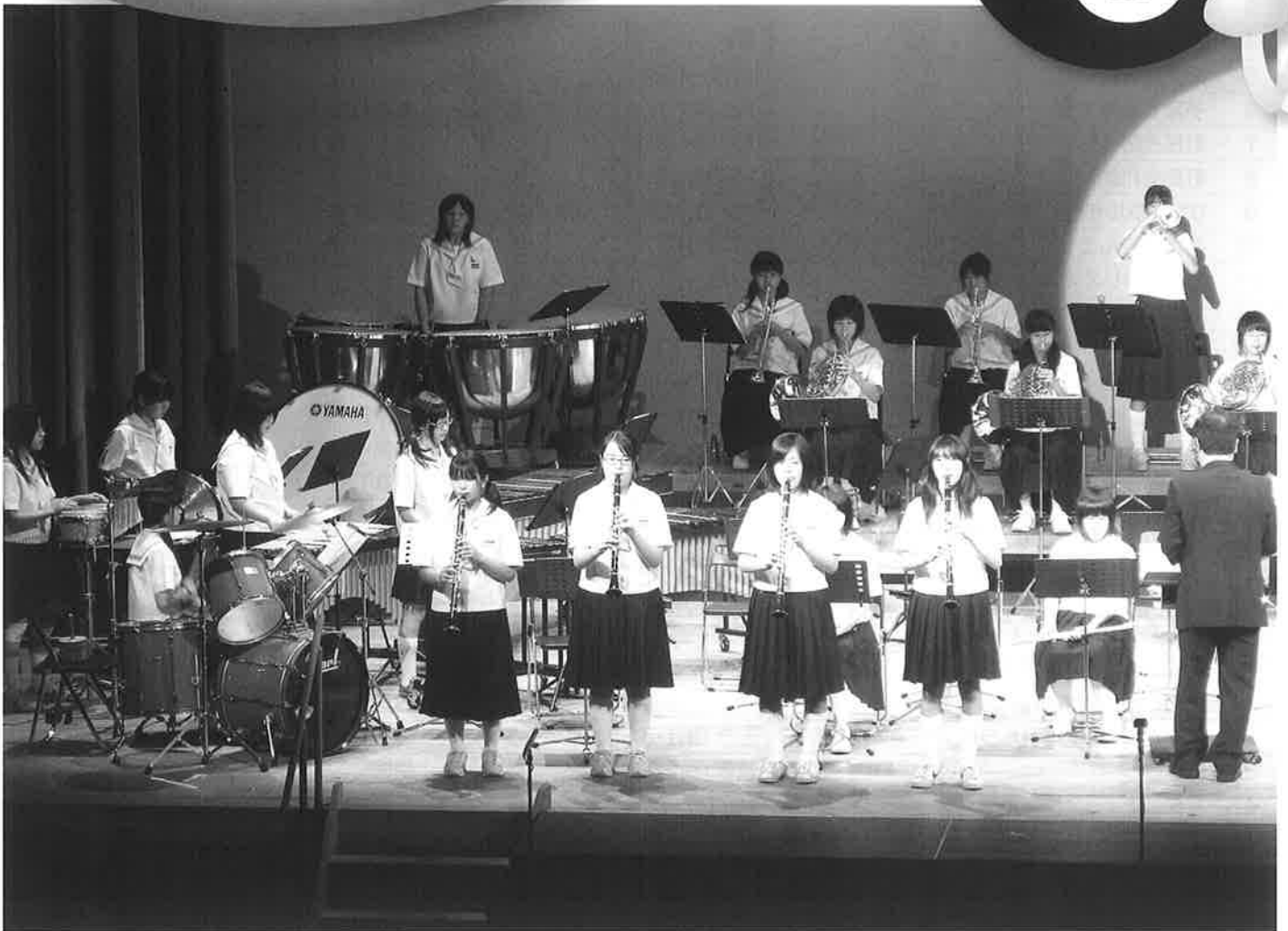
第24回ヨコゼ音楽祭「ふれあいコンサート」横瀬中学校音楽部(8/22)