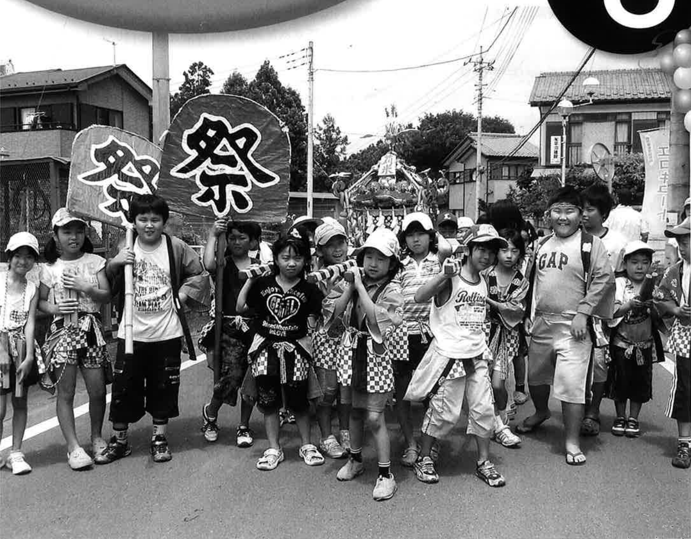
元気なかけ声とともに夏本番! (苺米ちびっ子祭り 7/20)