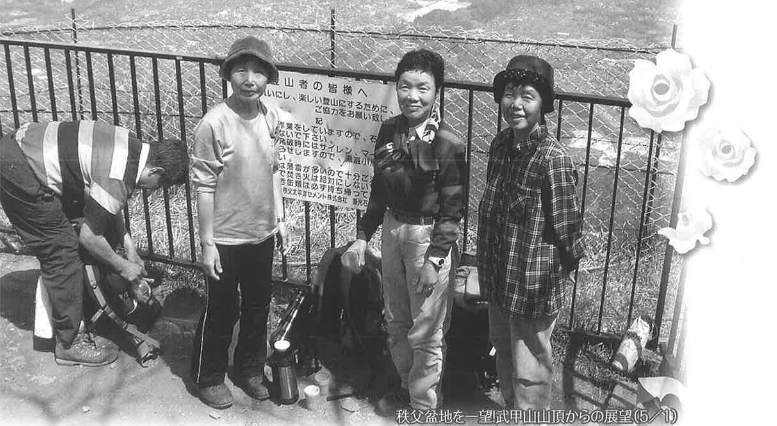
秩父盆地を一望 武甲山山頂からの展望(5/1)